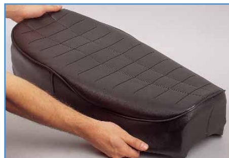
4. Passen Sie sich an.

3. Wenn die Blechlaschen alle hochgebogen bzw. die Tackerklammern entfernt sind, wird der alte Bezug abgenommen. Sitzbankkern und Grundplatte werden nun auf Schäden untersucht. Eine korrodierte Metallgrundplatte wird per Drahtbürste entrostet und mit Rostschutzfarbe (Best.Nr. 10004284) behandelt. Diese kann ggf. überlackiert werden. Der Sitzbankkern aus Schaumstoff wird auf Beschädigungen und Feuchtigkeit untersucht. Nässe sollte gut austrocknen. Das kann mehrere Tage dauern, ist aber unerlässlich. Größere Löcher müssen ausgebessert werden, da der neue Bezug sonst nicht