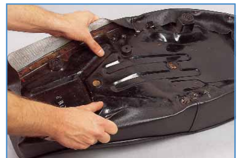
6a. Seitliche Befestigung an der Metallplatte.

5. Nun kommen wir zum schwierigsten Teil, dem Spannen und Befestigen des Bezuges. Zunächst beschreiben wir die Befestigung an Sitzbänken mit Metallgrundplatte, das Vorgehen bei Kunststoffgrundplatten wird anschließend erläutert. Legen Sie die Sitzbank mit der Sitzfläche auf den Boden und beginnen Sie am Heck.