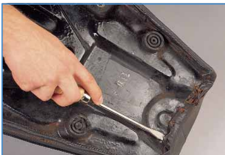
2. Halter & Co. entfernen.

Den neuen Sitzbankbezug nehmen Sie am besten zwei Tage vor Reparaturbeginn aus der Packung und breiten ihn in einem warmen Raum aus, damit die Packfalten verschwinden. Für die Reparatur wird nicht viel Werkzeug benötigt – Schraubendreher , Zange , Pattex®, eine Heißklebepistole (Best.Nr. 10032010), bzw. ggf. ein Tacker und ein Teppichmesser genügen. Als kleine Helfer haben sich ein paar Klemmen aus dem Baumarkt bewährt, um ggf. die dritte und vierte Hand zu ersetzen.