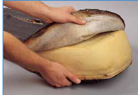
3. Hier „nackisch“ machen.

2. Bevor es dem Bezug an den Kragen geht, schrauben wir alles ab, was uns bei dem Beziehen behindern könnte. Dazu gehören z.B. Halteriemen, Zierleisten, Halter und Gummipuffer an der Unterseite der Sitzbank. An einer Metallgrundplatte müssen meist Blechhaken aufgebogen werden – dazu benutzt man einen Schraubendreher. Sind die Haken erst etwas abgehoben, lässt sich eine Zange zum richtigen Wegbiegen ansetzen. Tackerklammern an einer Kunststoffgrundplatte können mit einem kleinen Schraubendreher abgehoben werden.