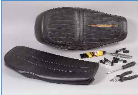
1. Die kleinen Helfer im Überblick.