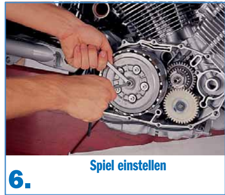
6. Spiel einstellen

oder einem Lappen so ab, dass Sie sich die Einbau-Reihenfolge merken können.