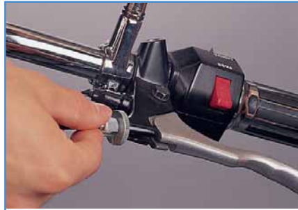
8. Bowdenzug nachjustieren