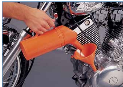
9. Öl einfüllen