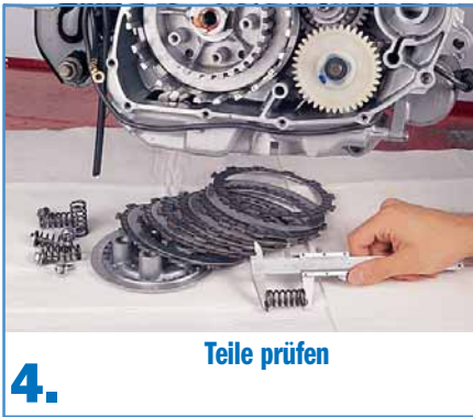
4. Teile prüfen