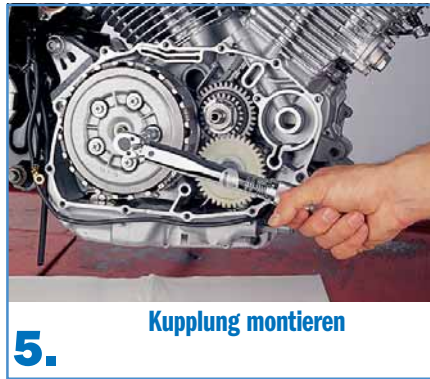
5. Kupplung montieren