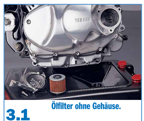
3.1 Ölfilter ohne Gehäuse.