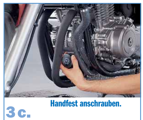
3 c. Handfest anschrauben.