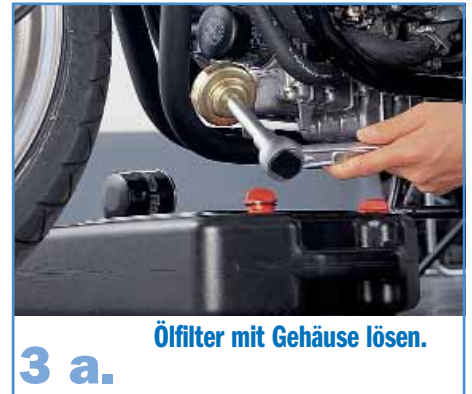
3 a. Ölfilter mit Gehäuse lösen.

3.1 Die Filter, die aussehen wie ein Miniakkordeon, befinden sich in einem Gehäuse, das von einer zentralen oder mehreren am Rand angeordneten Schrauben gehalten wird. In fast allen Fällen befindet es sich an der Stirnseite des Motors. Nachdem der Deckel abgeschraubt wurde (Achtung – es tritt Restöl aus), entnimmt man den alten Filter, reinigt das Gehäuse und legt den neuen Filter richtig ausgerichtet ein. Je nach Hersteller befinden sich am Gehäuse, Deckel oder einer Zentralschraube Dichtungen und Dichtringe , die wir alle erneuern müssen. Nachdem wir das Gehäuse wieder verschlossen und die Schrauben mit einem Drehmomentschlüssel angezogen haben, entfernt man mit einem Reiniger alle Ölflecken vom Motor. Das Reinigen sollte ernst genommen werden, weil sich sonst bei heißem Motor übelriechende Gase entwickeln und äußerst hartnäckige Flecken entstehen können.