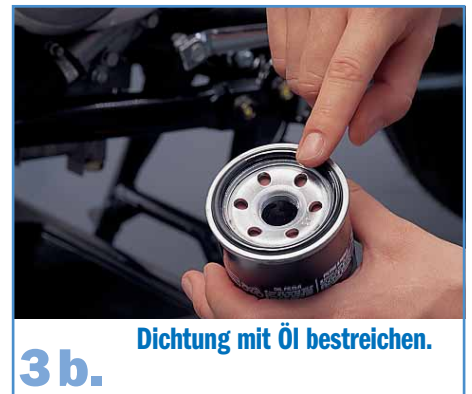
3 b. Dichtung mit Öl bestreichen.