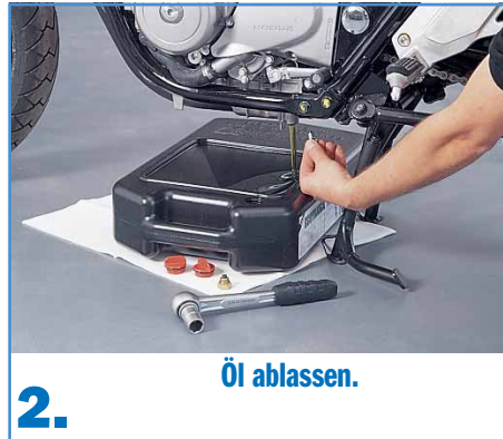
2. Öl ablassen.

Zu einem kompletten Ölwechsel gehört auch der