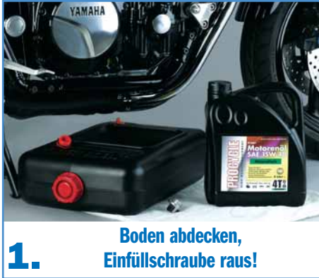
1. Boden abdecken, Einfüllschraube raus!

Bei uns Menschen blättert der Glanz so ab 30 langsam ab. Motorenöl ergeht es genauso – nur sehr viel früher. Die Additive und Schmierfähigkeiten lassen bei einem Motorrad-Motorenöl nach ca. 6000 km oder einer Zeit von einem Jahr nach Ersteinbau im Motor nach. Dann ist es Zeit, die „Soße“ zu erneuern und die alte fachgerecht zu entsorgen.